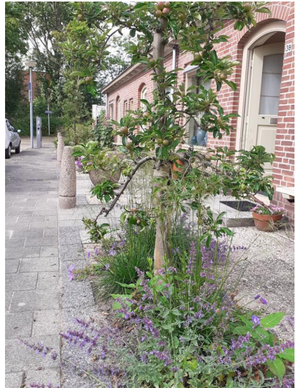
Groene biodiverse perken met appelbomen in plaats van tegels