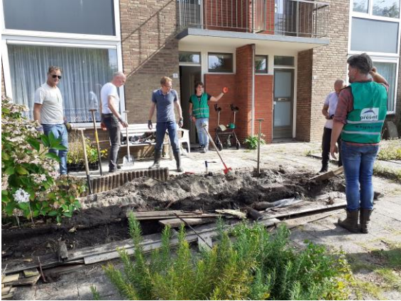
Tegels eruit en aanleg van vernieuwde groene tuin