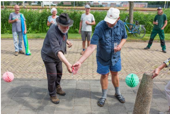
Feestelijke opening door bewoners van hun vergroende straat

In maart 2021 hebben we samengewerkt met Stichting de Waaier in de organisatie van de Nationale Pannenkoekendag, waarbij er verschillende vrijwilligers o.a. studenten van het Horizon college, gezinnen en Present flex vrijwilligers via Present pannenkoeken hebben gebakken voor bewoners van zorgcentra, alleenwonende ouderen binnen het Present netwerk en bewoners van begeleid wonen.