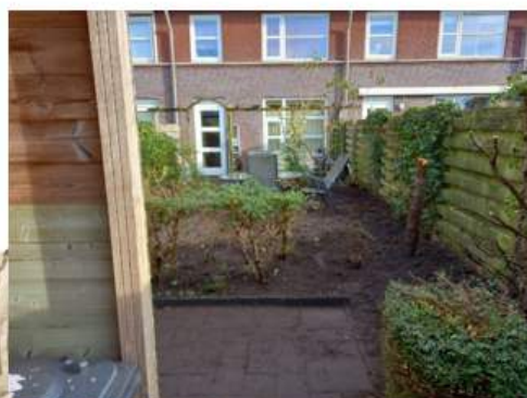
(Voor-, tijdens en na foto tuinproject)