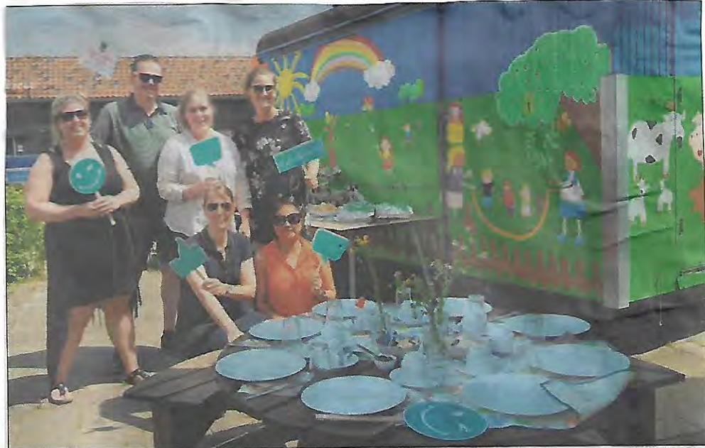
De collega's genoten duidelijk minstens zoveel van de gezelligheid en ontspanning als hun gasten.