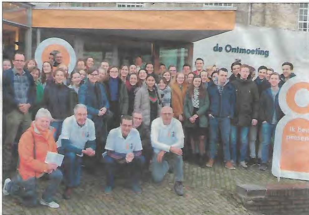
De Diacodoe startte 's morgens bij de Ontmoeting.