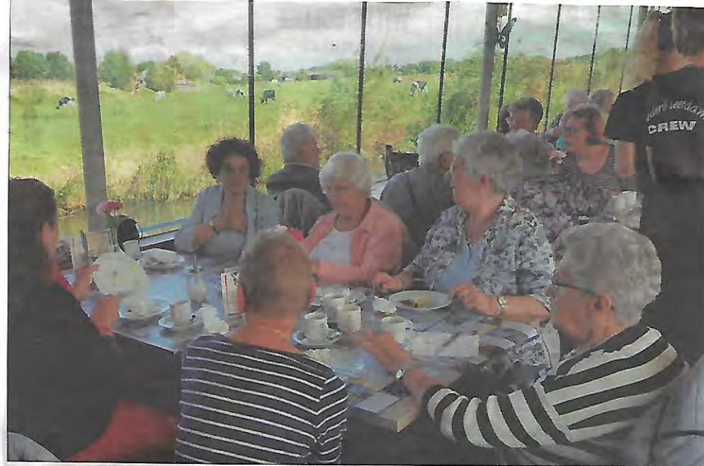
Lunch met uitzicht op het landschap rond Leerdam.