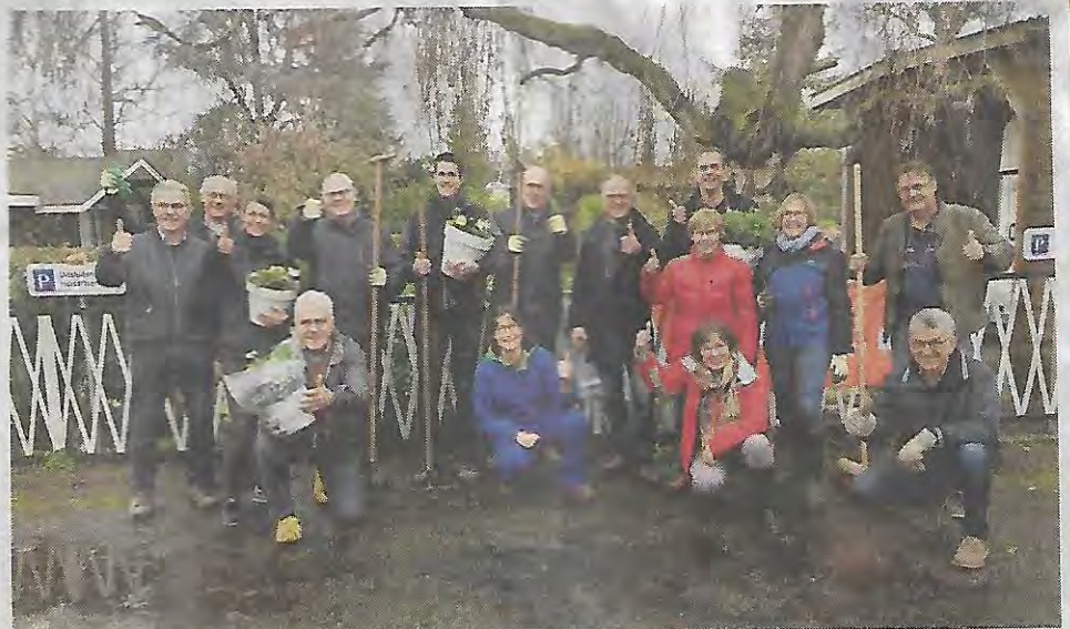
Stichting Present had veel mensen op de been gekregen