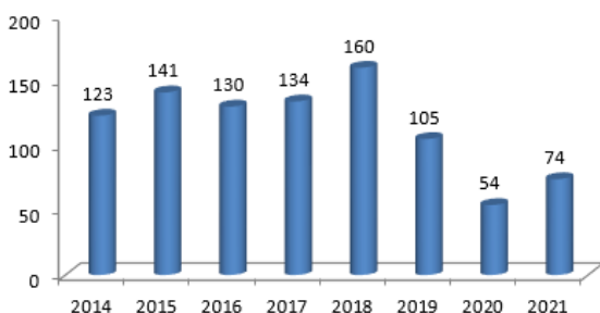
Projecten Den Helder