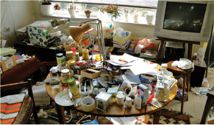
^ Voorbeeld van een verwaarloosde woning