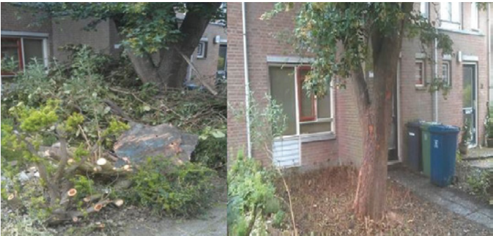
^ Voor en na: foto's van een project waar Present heeft geholpen een tuin op te knappen.