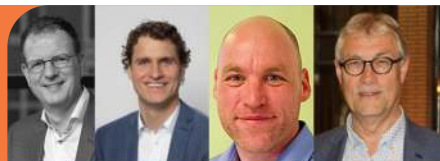
AMBASSADEURS PRESENT RIDDERKERK

De ambassadeurs dragen Present Ridderkerk een warm hart toe en zijn elk op hun eigen manier betrokken bij Present. Ze zetten concreet hun kennis en netwerk in om de stichting te ondersteunen. We zijn blij dat deze mensen verbonden zijn met Present!