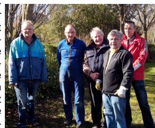
Een paar mannen van de flexgroep

Flex staat voor flexibel inzetbaar. Breed inzetbaar bij, onder andere, muren sauzen, laminaat leggen, tuin opknappen, verhuizen. Elk lid geeft aan op welke dagen hij/zij in het jaar beschikbaar is. Zodra er meerdere flexers beschikbaar zijn op één dag zoekt Present een geschikt project. Meestal bestaat de groep voor zo'n dag uit ca. 4 personen. Is de klus groter dan voorzien, bijvoorbeeld diepgelogen boomstronken in een tuintje of moeilijk te verwijderen behang op een te sauzen muur, dan wordt er harder gewerkt of een andere goede oplossing gevonden. Ook daarin zijn de Flexers flexibel. En als de klus geklaard is en de betreffende bewoner blij is wordt afscheid genomen met: 'Graag gedaan' en tegen elkaar 'Tot ziens en tot een volgende keer'.