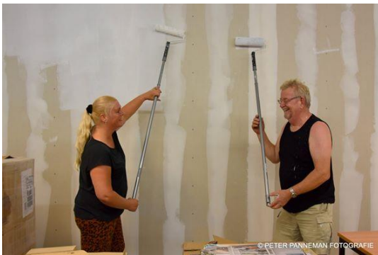
SP bij de Voedselbank Veendam