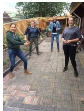
"Jong Present" van 2019 ook in 2020 in actie