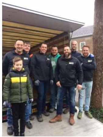
Bouwbedrijf Van der Flier B.V. in actie