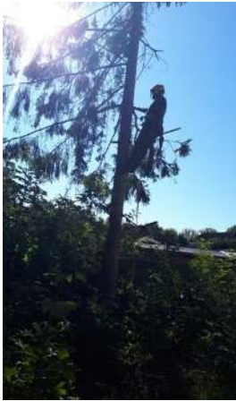
Een hovenier aan de slag